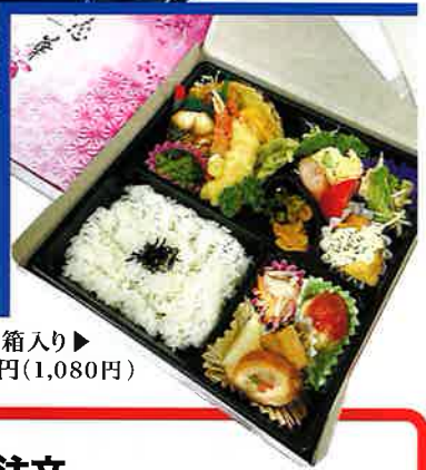
写真は箱入り▶ 1,000円(1,080円)